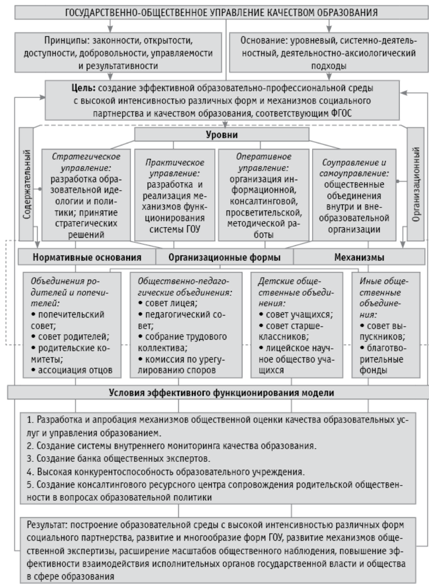
Рис. 1. Организационно-функциональная модель государственно-общественного управления качеством образования в ОУ

Модель разработана в соответствии с Конституцией Российской Федерации, Федеральным законом № 273 «Об образовании в Российской Федерации», Федеральным законом «Об общественных объединениях», Федеральным законом «О некоммерческих организациях», государственной программой Российской Федерации «Развитие образования» на 2013–2020 годы, Указом Президента Российской Федерации от 7 мая 2012 года № 597 «О мероприятиях по реализации государственной социальной политики».